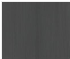
Touch Dark DA