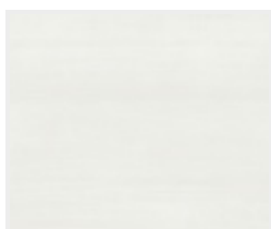
Touch white DQ