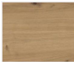
Touch dub Wild DQ