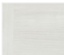
Touch grey DQ