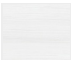
Touch Pearl DQ