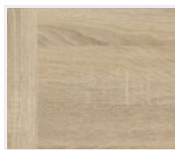
Touch dub DQ