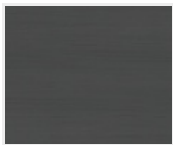
Touch Dark DQ