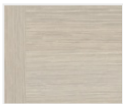
Touch pínia DQ