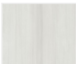
Touch grey DA