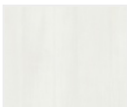
Touch white DA