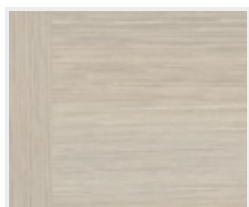
Touch pínia DQ