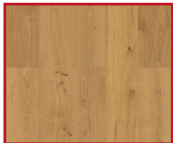
Dub Markant (zvislo)