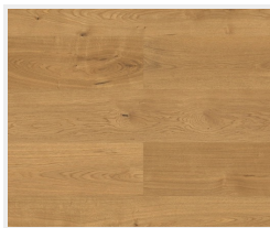
Dub Markant (priečne)