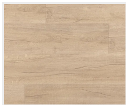
Dub svetlý (priečne)