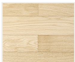
Drevená podlaha svetlá (priečne)