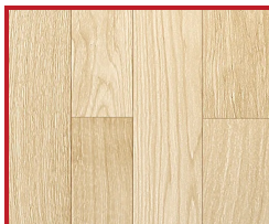
Drevená podlaha svetlá (zvislo)