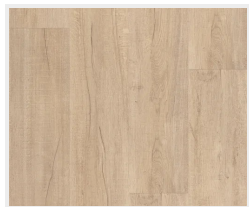
Dub svetlý (zvislo)