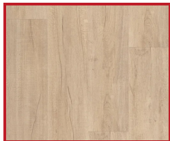
Dub svetlý (zvislo)