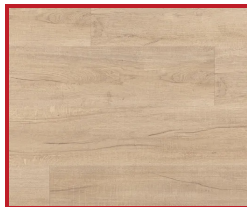
Dub svetlý (priečne)