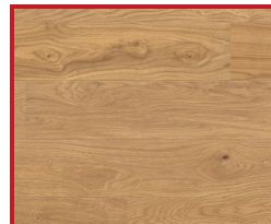
Dub Markant silk (priečne)