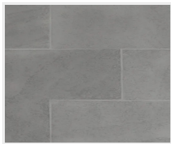
Dlažba (svetlo šedá)