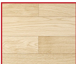
Drevená podlaha svetlá (priečne)