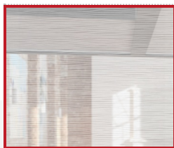
Wood 1 DQ