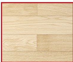
Drevená podlaha svetlá (priečne)