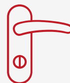
Príslušenstvo k dverám