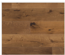
Dub Mocca Rustikal (priečne)