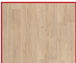
Dub svetlý (zvislo)