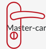
Príslušenstvo k dverám