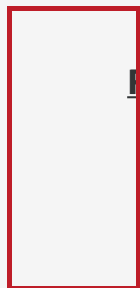
Wood 1 DA